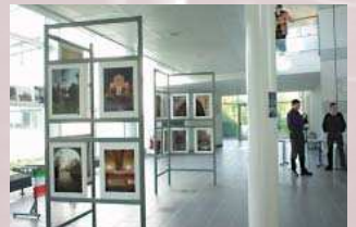
Vue partielle de l'exposition sur Ferrare